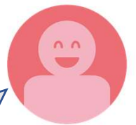
代表取締役 5店舗 家具販売店

他の会社がどんな風にシステム活用しているか一番知りたかった。 ウチは国内メーカーの直接仕入れが多く、手作業で運用管理してる。この紙の作業部分を効率化したい。けどアナログ業務は絶対になくならないとは思っています。御社のシステムはアナログ業務をそのままシステム化できるので良いポイントですね。