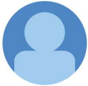
システム管理者 1店舗 家具小売

セミナー見たけど、表情が硬かったかなー?けど内容はすごく分かりやすかったです。 このセミナーを見てデモを依頼しました。 セミナーの中で家具小売りが5年で15%減少したけど、それでもシステム化してない。 理由は『今までなんとかなってるから』 という言葉があった。この言葉は響きました。。うちもそうなるかもしれないと。